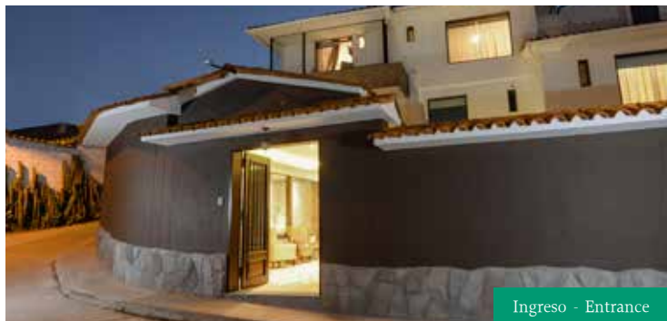
Ingreso - Entrance